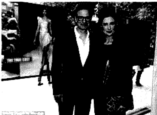
INCANTO A sinistra, l'attore Colin Firth; a destra, Bellagio, che anche quest'anno ospita a Villa Serbelloni il Festival musicale ispirato a Liszt, che terminerà l'8 settembre

Star di Hollywood per il Lake Como Festival Letteratura a Zelbio e orchestre a Bellagio